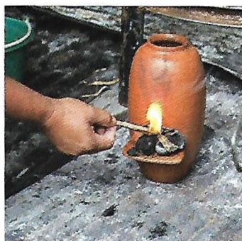
Open Fires , Great Design Gallery, Paris (9 janvier - 27 février 2016).

Pour les vases, une petite plateforme accolée sert à un enfumage de quelques minutes.